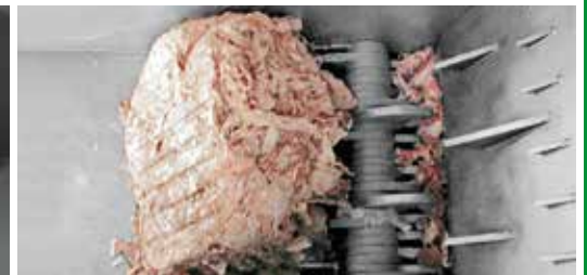
Einwellenbrecher Typ 492 Одновалный измельчитель Тип 489